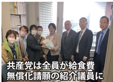
共産党は全員が給食費無償化請願の紹介議員に

市長はこれまで、給食費無償化を拒否し続け、自民党も無償化を求める市民請願の採択に同意してきませんでした。しかし今回、市長も自民党も180度その態度を変えた背景には、総選挙での自民党政治への国民の審判があります。市民・国民の要求を取り入れなければ政治が立ち行かなくなる「新しい政治プロセス」がはじまっています。